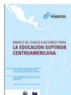
Consejo Superior Universitario Centroamericano