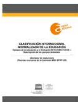
Organización de las Naciones Unidas para la Educación, la Ciencia y la Cultura