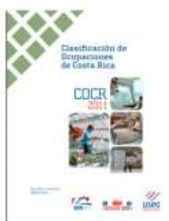
Instituto Nacional de Estadística y Censos de Costa Rica